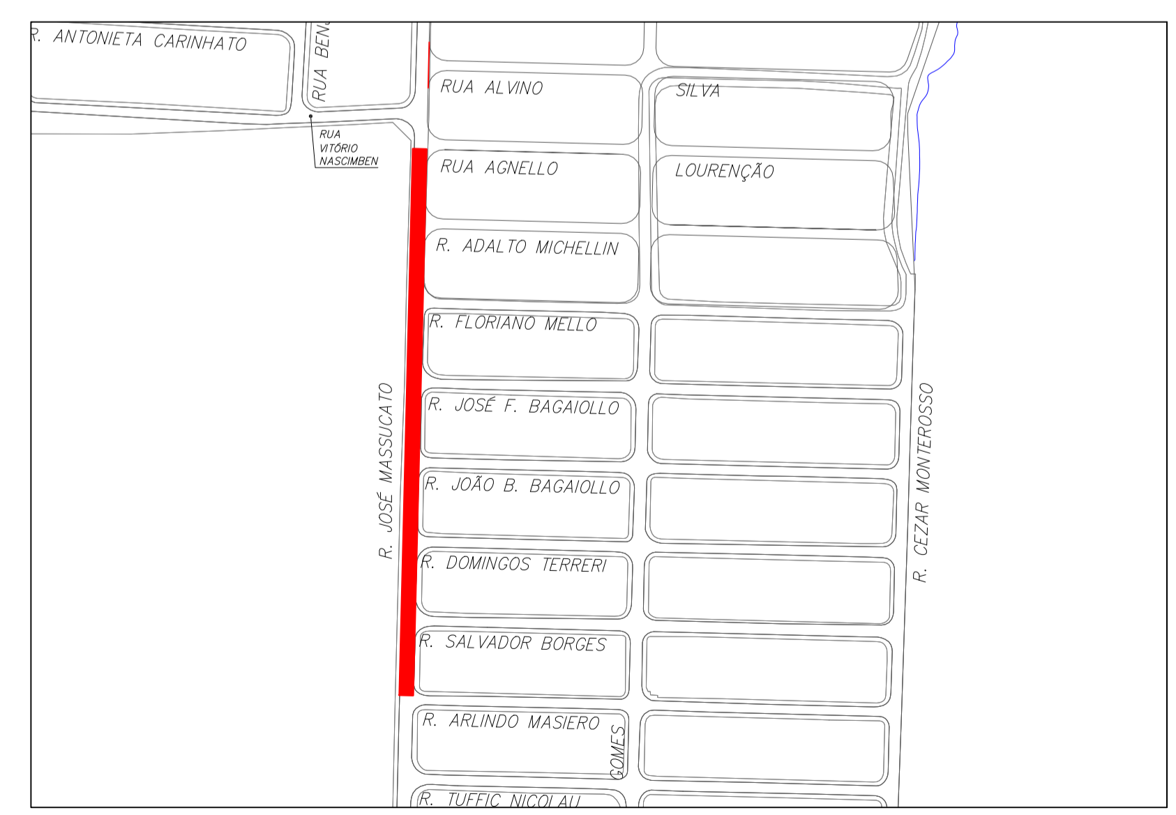
IMPLANTAÇÃO - R. MANOEL GONÇALVES AVANTE SEM ESCALA