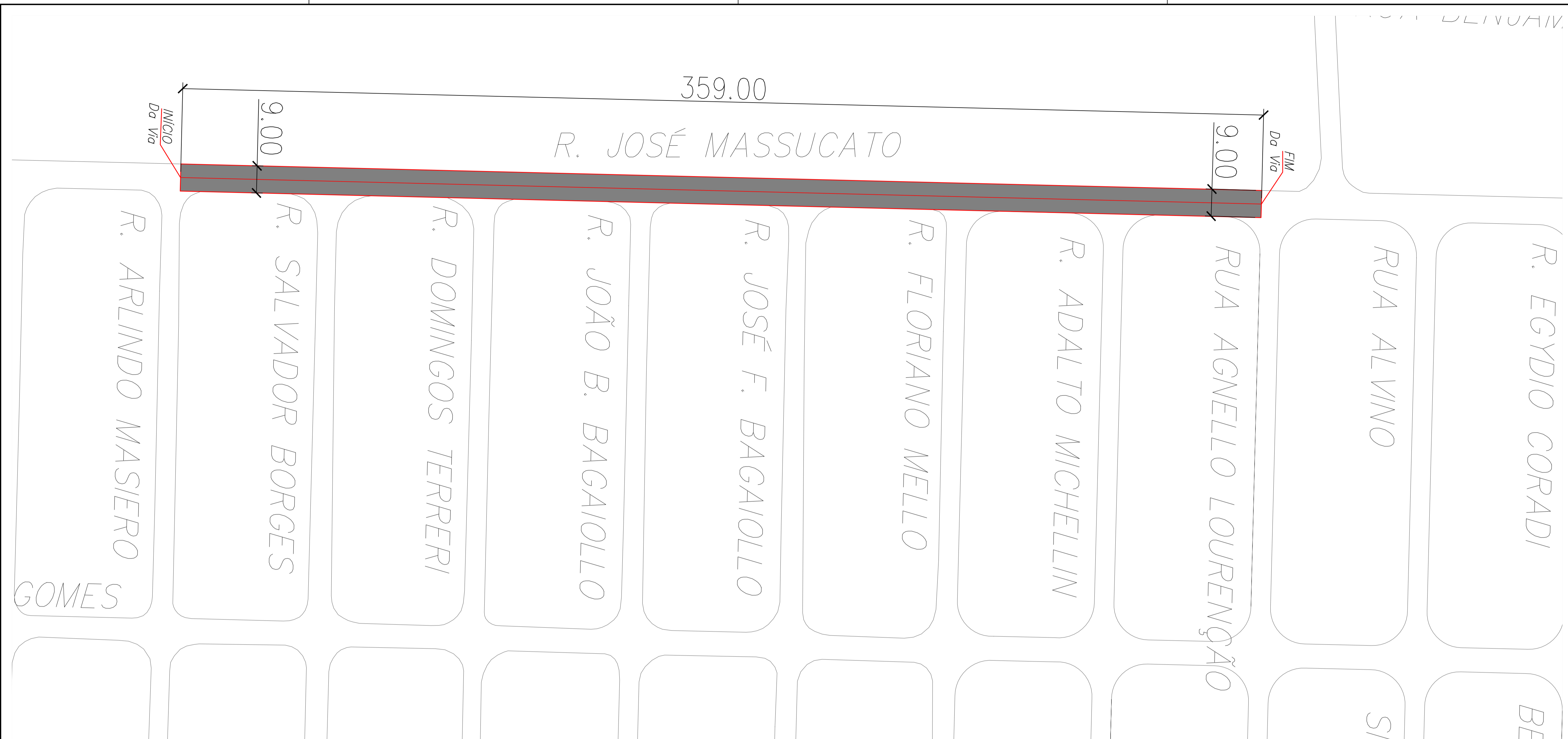
PLANTA - R. JOSÉ MASSUCATO ESC.: 1/500